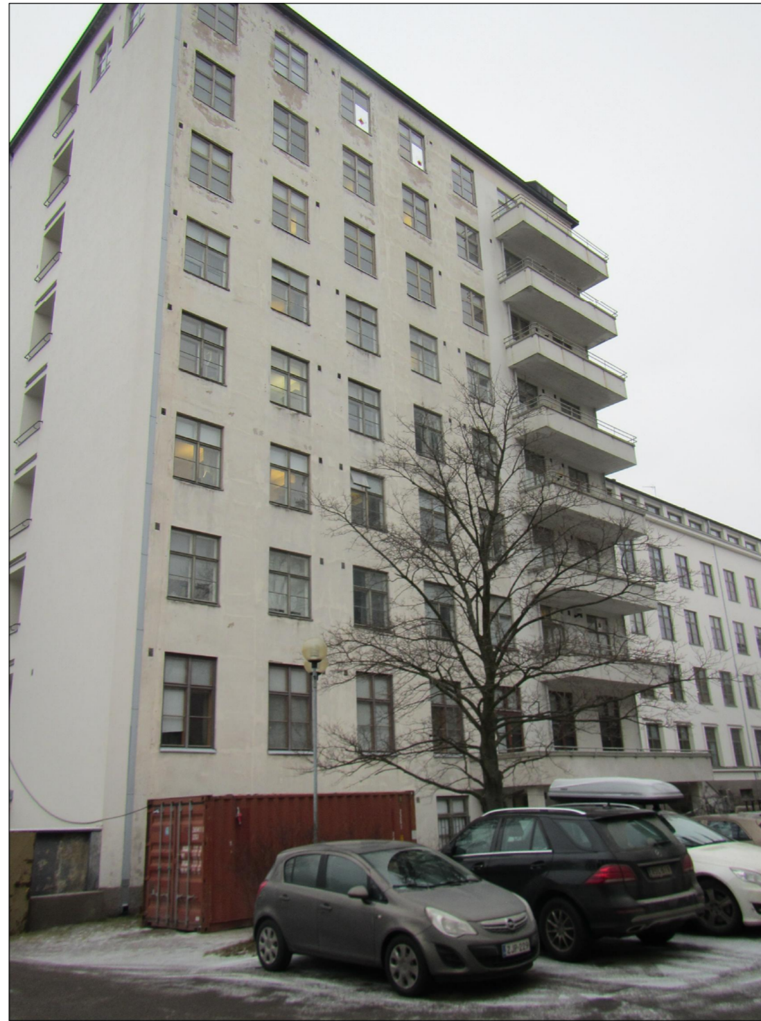
Yleiskuva vaiheen 11 julkisivusta