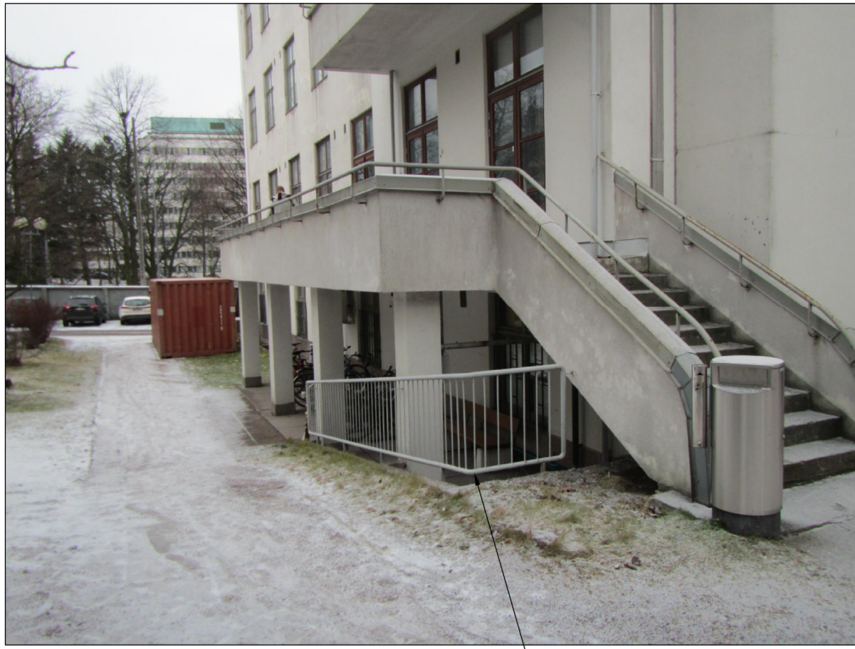
Ensimmäisen kerroksen betonirakenteinen terassi